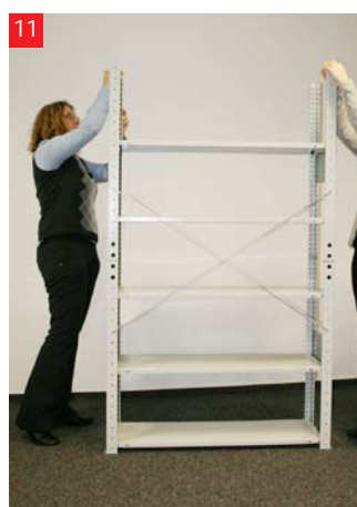
11 Nałóż taśmę