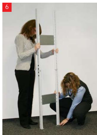
6 Dołącz stopy regału