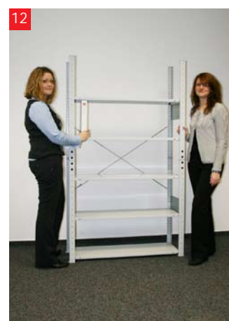
12 ... i gotowe!