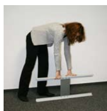
2 Połącz ze sobą cztery profile