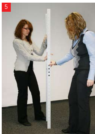
5 Zamontuj kątki zabezpieczające