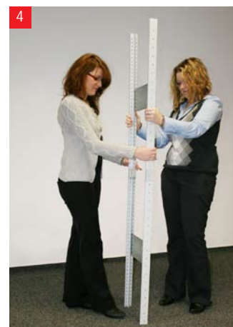
4 Zmontuj ramę