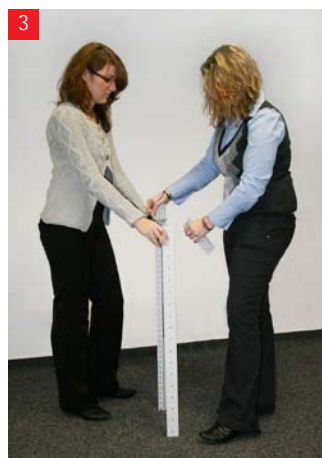
3 Wetknij plastikowe nakładki