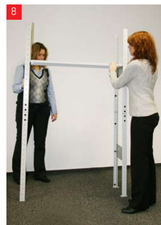
8 Zawieś półki