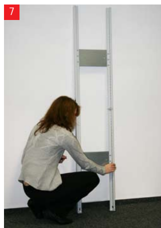
7 Zamocuj zawieszki na półki