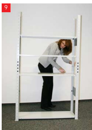
9 Rozmieść półki na dowolnej wysokości