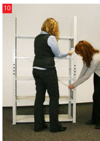
10 Zabezpiecz regał systemem ukosnym