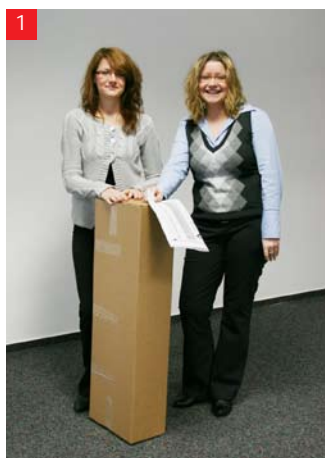
1 Wszystko co potrzebne do budowy regału zawarte jest w jednym pudełku